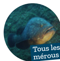
Tous les mérous

AP n°R93-2023-12-08-00001 et AP n°R93-2023-12-08-00002 du 8 décembre 2023