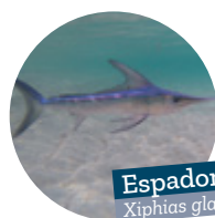
Espadon Xiphias gladius