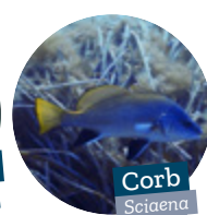
Corb Sciaenops ocellatus