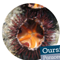
Oursin Paracentrotus lividus

Arrêté n°R93-2023-09-29-00001 du 29 septembre 2023