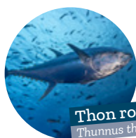
Thon rouge Thunnus thynnus